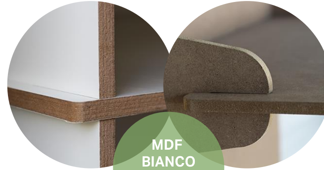
MDF BIANCO E GREZZO

Superficie bianca o marrone scura. Liscio al tatto dal look elegante.