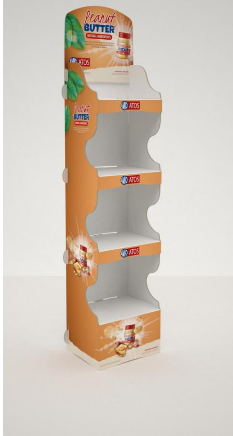
C7102 Belly 40